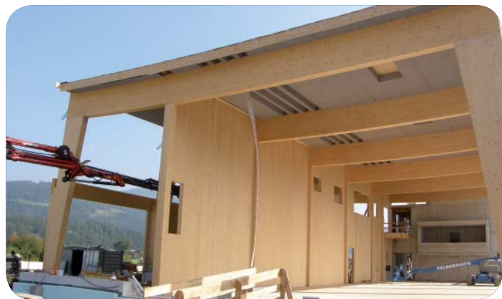
Leimbinderkonstruktion mit ansprechender Architektur bilden das Grundgerüst der neuen Werkstättenhalle

Für Interessierte gibt es die Möglichkeit den Baufortschritt zu besichtigen. Infos auch unter www.holztechnikum.at .