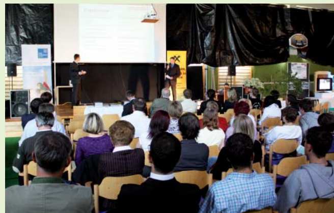
Großes Interesse anlässlich der Präsentation der Diplom- und Abschlussarbeiten sowie der Verleihung des HTK-Awards im Juni