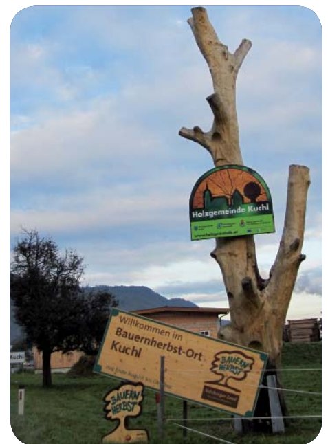
Neue Ortseinfahrtstafeln für die Holzgemeinde Kuchl

Weiters soll ein Holzkongress veranstaltet werden, dieser wird gemeinsam mit dem „Genialen Kuchler Holzweg“ und den Kuchler Holzfestspielen im Oktober 2010 stattfinden.