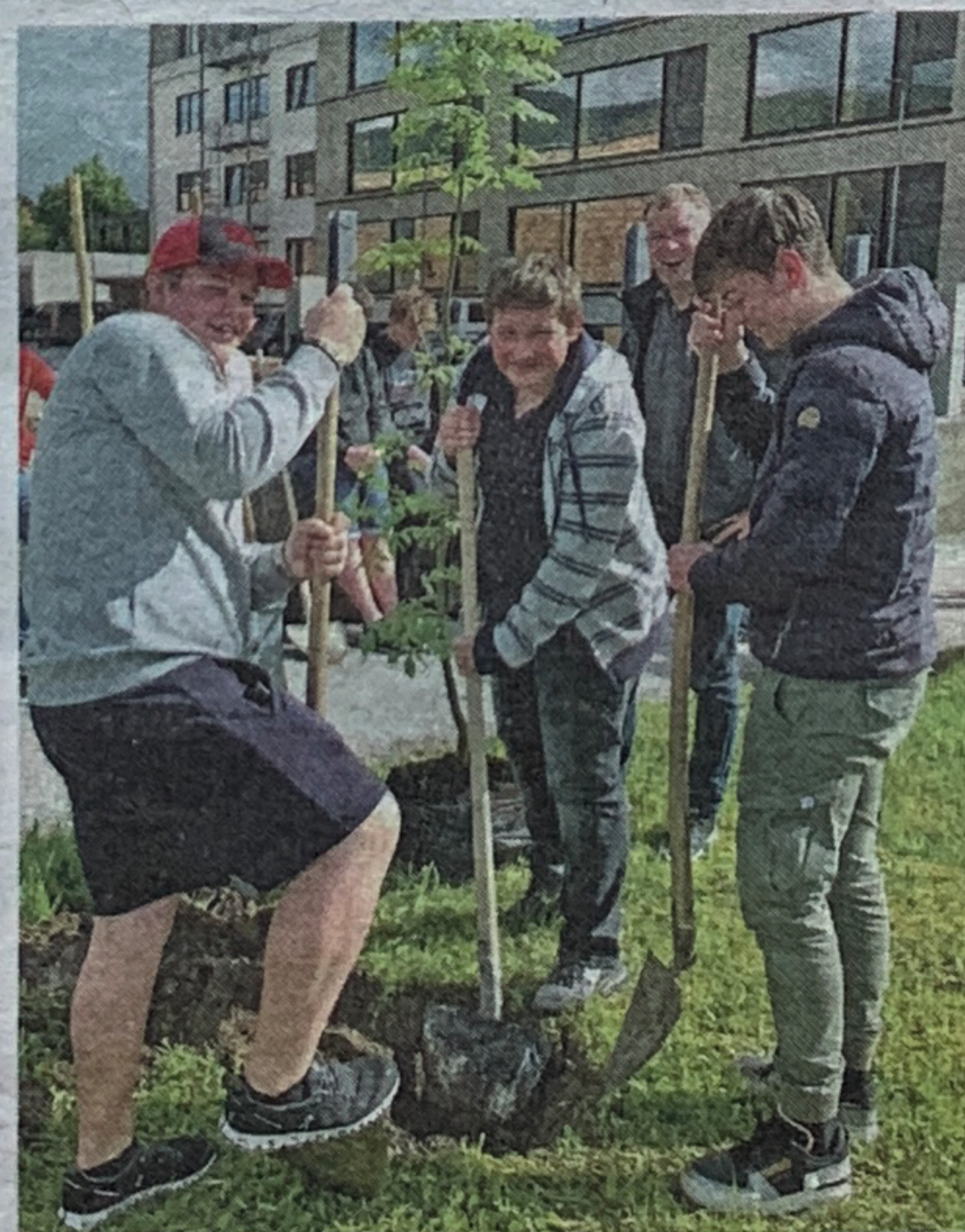
Die Esche bekam den Platz vor der Werkstättenhalle.